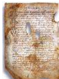
Псковская судная грамота

Двинская уставная грамота 1397 года. Мздоимство упоминается в русских летописях XIV века, например в Двинской уставной грамоте 1397 года в статье 6: «А самосуда четыре рубли, а самосуд то: кто изыснав татя с поличным, да отпустит, а себе посул возьмет, а наместники доведаются по заповеди, ино то самосуд, а опричь того самосуда нет». Там же, в статье 8: «...а черес поруку не ковати, а посула в железех не просити; а что в железех посул, то не в посул».