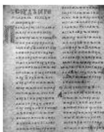
Двинская уставная грамота

Лихоимец – жадный вымогатель, взяточник».